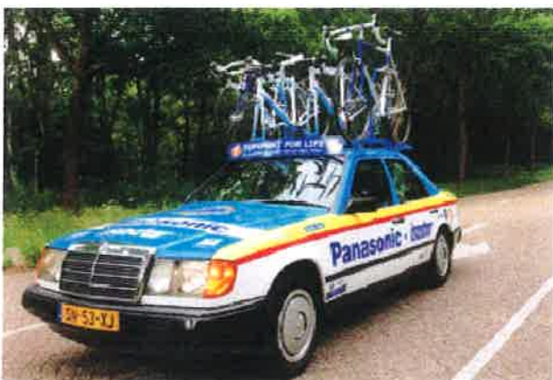
De Topsport for Life ploegleidersauto

Ook nu werden onze gasten als VIP ontvangen en hebben zij van dichtbij de wedstrijden en de profrenners op zaterdag en zondag kunnen kijken. We kregen van de organisatie helaas geen toestemming om met onze klassieke en historische ploegleidersauto mee te rijden in de wedstrijden, maar moesten genoegen nemen met een plekje in de reclamekaravaan.